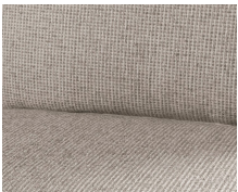
+ Stoffkombinasjon Heron (tekstilsjinn) ○