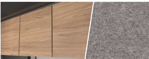
+ Tredekor Ashton