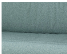
+ Stoffkombinasjon Badalona ○