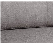
+ Stoffkombinasjon Tarragona ○