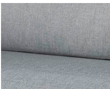
+ Stoffkombinasjon Amposta