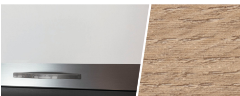
+ Tredekor Amberes Oak