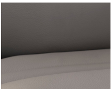
+ Ekte skinn Collin ○