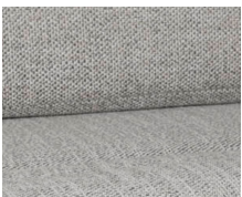
+ Stoffkombinasjon Samir