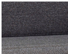
+ Stoffkombinasjon Melia ○