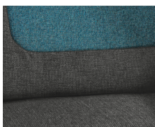
+ Stoffkombinasjon Salerno inkl. fører- og passasjerstettrekk