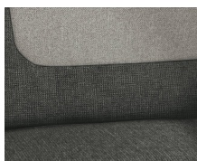
+ Stoffkombinasjon Calypso inkl. fører- og passasjerstettrekk ○