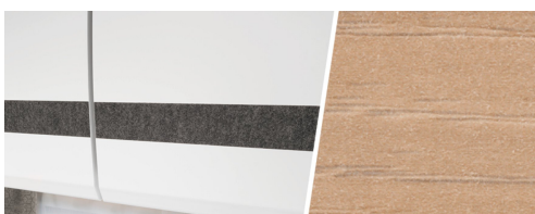
+ Tredekor Noce Nagano