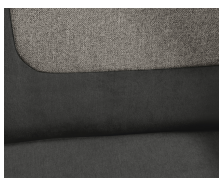
+ Stoffkombinasjon Ravello