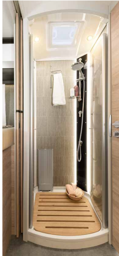
Stort dusjkabinett med pleksiglassdører, regndusj og stemningsbelysning