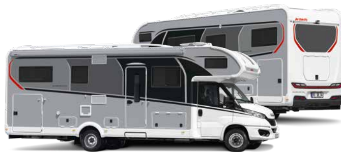
Hvit /titansilver metallic (tilleggsstyr)