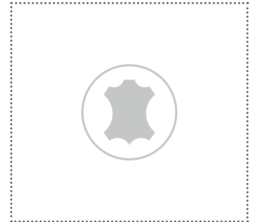
Individuell (ekte skinn, tilleggstyr)