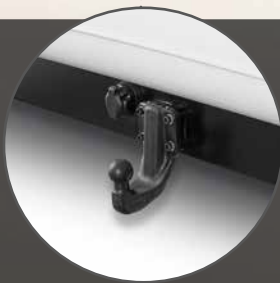
Tilhengerlast på 3,5 t bremset, tilhengerfeste (tilleggsutstyr)