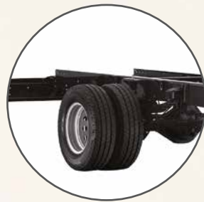
Bakhjulsdrift med tvillingdekk og luftfjæring på drivakselen