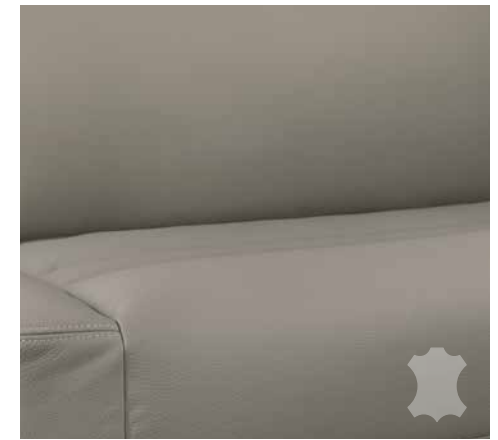
Collin (ekte skinn, tilleggstyr)