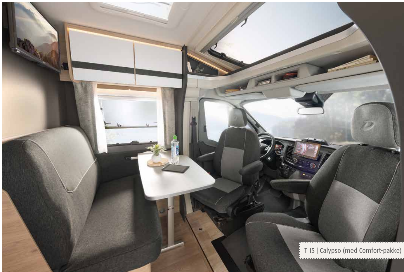
T 15 | Calypso (med Comfort-pakke)