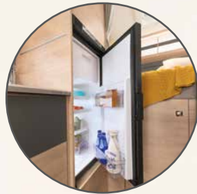
Elektrisk kompressorkjøleskap med utmerket kjøleeffekt