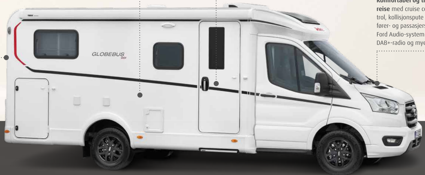
Komfortabel og trygg reise med cruise control, kollisjonspute på fører- og passasjersiden, Ford Audio-system med DAB+-radio og mye mer