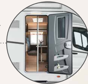
70 cm bred inngangsdør med mygnetting (T 45)