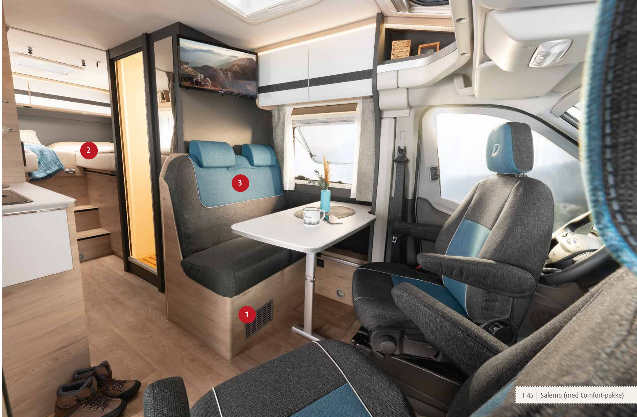
T 45 | Salerno (med Comfort-pakke)

1 Den dieseldrevne luftbårne varmen er installert under sittebenken og gir varme midt i bilen, akkurat der det trengs.