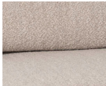
+ Stoffkombinasjon Olea ○