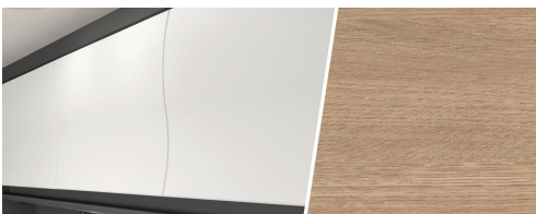
+ Tredekor Amberes Oak