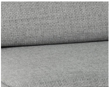
+ Stoffkombinasjon Amposta