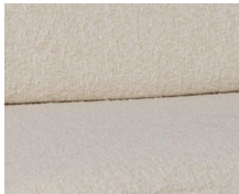
+ Stoffkombinasjon Tropea ○