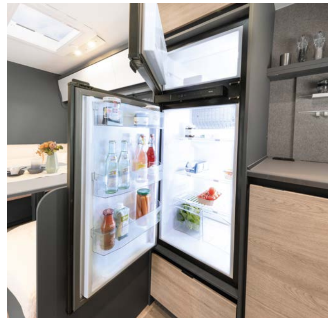
Her holder maten seg fersk. Kjøleskap med fryseboks med samlet volum på 137 eller 156 l (modellavhengig) og automatisk energivalg AES.