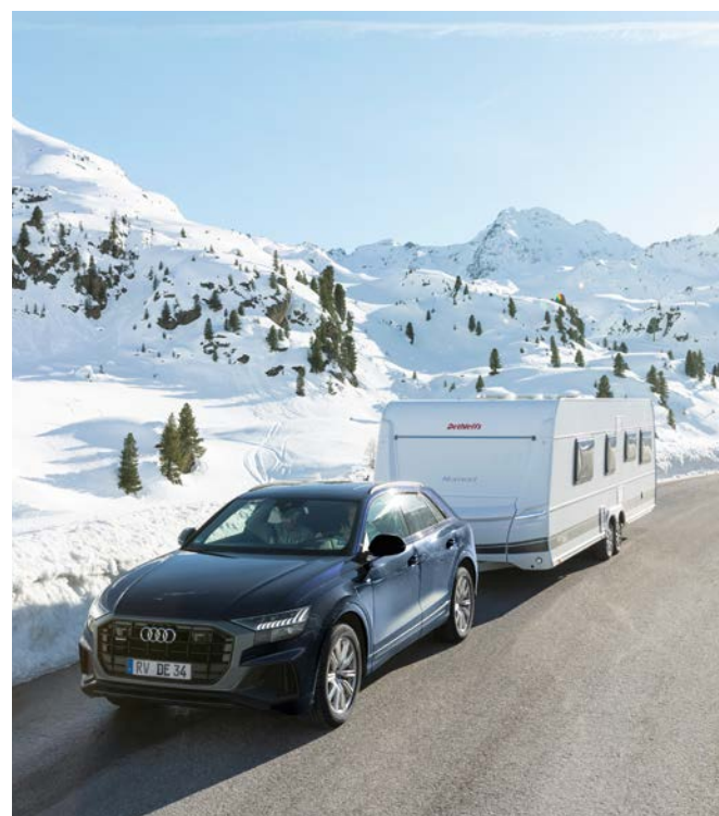
Dethleffs vinterkomfort-pakke som tilleggsutstyr gjør campingvognen vintersikker.