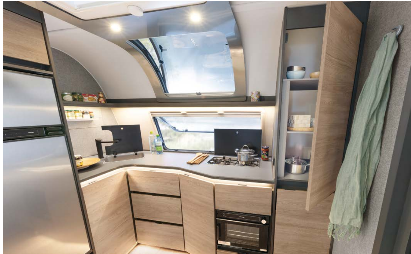
Kjøkkenene foran i Beduin er rett og slett fenomenale. De overbeviser både når det gjelder utstyr, oppbevaringsplass og armslag. Og den store vindusfronten slipper inn masser av lys og frisk luft samtidig som den gir godt utsyn. • 690 BQT