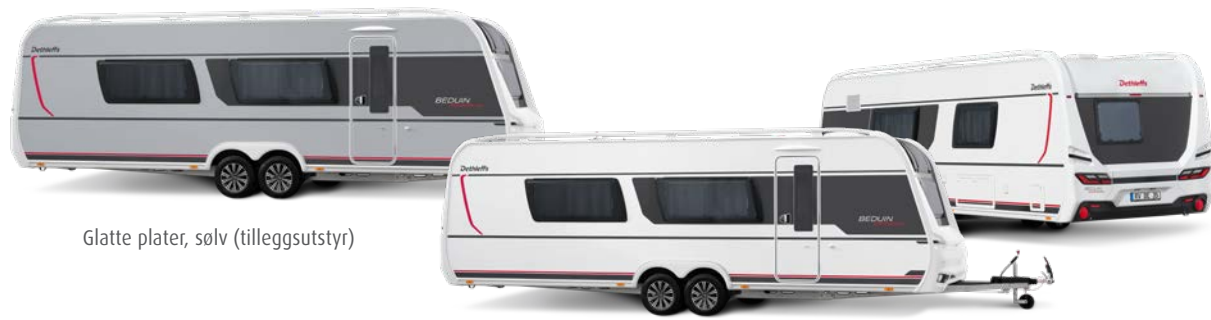
Glatte plater, sølv (tilleggsutstyr)