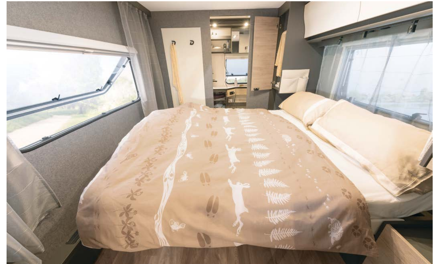
Den romslige midtstille dobbeltsengen kan flyttes forover og bakover og gir bedre tilgang til badet om dagen. Under sengen er det et stort oppbevaringsrom som også er tilgjengelig utenfra. • 690 BQT