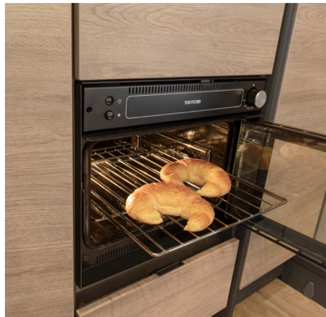
Enten det er rundstykker, kake eller pizza som står på menyen, sørger stekeovnen (standardutstyr) for god smak på ferien.