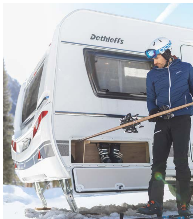
En ferieleilighet like ved skibakken som det er godt og varmt å komme inn i.

Dette vinteregnete utstyret er basert på mange års erfaring. Det gjør det godt og varmt inni campingvognen, og sørger for at vannanlegget ikke fryser.