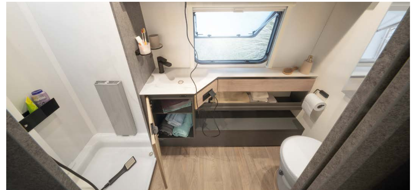
Et førsteklasses bad! God plass, separat dusjkabin, stilig, nedfelt servant og et vindu som kan åpnes. Rett og slett et utmerket sted å starte dagen på. • 690 BQT