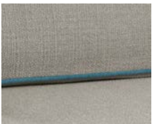
+ Wohnwelt Fyn