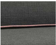
+ Wohnwelt Visby