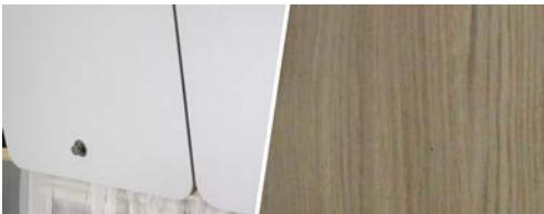
+ Holzdekor Maryland Oak