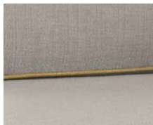
+ Wohnwelt Skagen